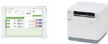
iPad (受付・呼び出し用) プリンタ